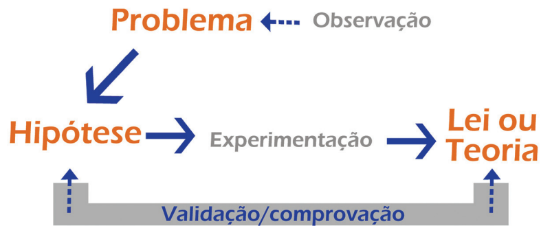
Figura 2: Esquema do método experimental.

A formulação de uma lei ou teoria inicia-se com a formulação de um problema e tem o seu termo quando o cientista consegue elaborar uma lei geral ou teoria capaz de dar conta do conjunto de fenômenos observados.